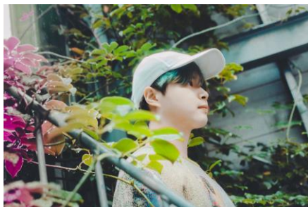
下北山村エリアディレクター ゴッドスコピオン